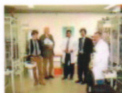
Bitte Bild anklicken!

Trotz „Sogwirkung“ aus Asien Bekenntnis zu Standort Schwabach